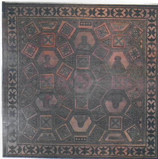
Philosophenmosaik (Römisch-germanisches Museum, Köln) 3. Jahrhundert